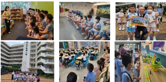
小學老師帶我們參觀不同的角落

幼稚園的環境及學習模式，跟小學有很大的區別。為了讓幼兒更了解當中的情況，好讓他們順利升上小學，本校安排高班幼兒到聖公會基福小學進行參觀。當天幼兒參與了不同的活動，體驗做小學生的滋味，真是一次很好的體驗呀！