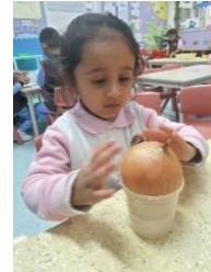
原來洋蔥也可以用水種植