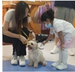
嘗試為小狗梳理毛髮