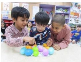
玩具蛋殼不用掉，可以用來學習數數