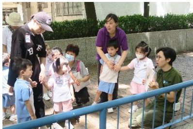
幼兒靜聽鳥兒的叫聲，並發現南昌邨四周原來都住了不同品種的鳥兒。

此外，學校亦為幼兒安排了一次「觀鳥自然探索遊」活動，讓幼兒透過周遊學校附近環境，從而觀察夏日的景致，認識常見的小鳥，培育愛護自然的品德。