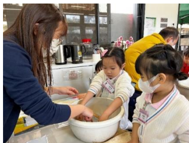
用網把紙碎撈起來。