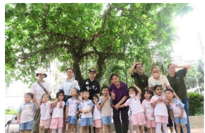
我們身後的大樹，原來結上了小鳥最喜歡吃的果子。