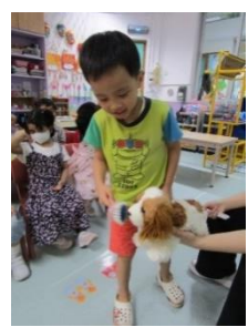
於課室裡，幼兒學以致用，模擬餵「小狗」布偶吃骨頭和洗刷身體