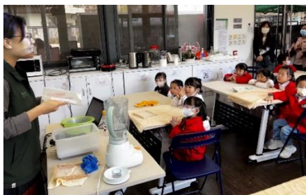
工作人員講解再造紙的製作步驟。

為了配合低班「保護環境」學習主題，幼兒親身到「綠在深水埗」製作再造紙以及認識不同種類的回收箱，讓幼兒學會減少浪費資源及明白循環再做的好處。