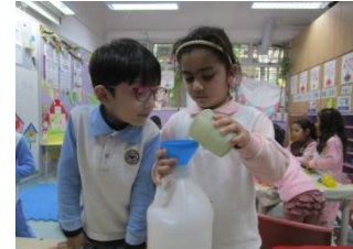
幼兒製作「橙皮酵素」，把糖、橙皮和水按比例放入樽內，製成「環保清潔劑」