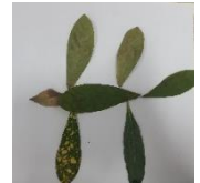
幼兒將拾回來的樹葉，發揮想像力，拼砌成一幅幅美麗的圖畫！