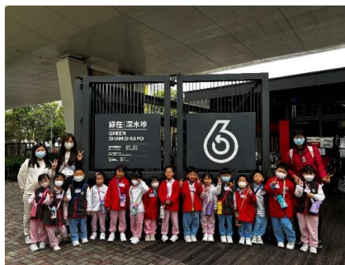
謝謝家長義工的幫忙!