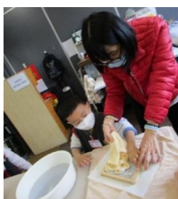
用毛巾將再造紙印乾。