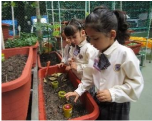
幼兒首次嘗試種植「紅蔥頭」！

透過「環保」主題，幼兒學習到種植植物的基本需要，以及各種種植的技巧，從而知道保護環境的重要性。此外，幼兒透過回收物品、分類和再造，學會善用地球不同的資源，大家一起來看看我們的活動花絮啦！