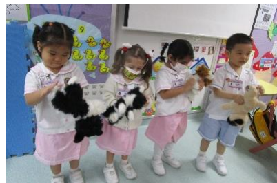
幼兒攬着自己喜歡的「寵物」布偶，一起創作句子「汪汪汪，誰在叫？」

此外，學校亦為幼兒安排了一次「觀鳥自然探索遊」活動，讓幼兒透過周遊學校附近環境，從而觀察夏日的景致，認識常見的小鳥，培育愛護自然的品德。