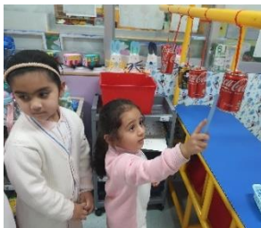
叮叮叮！鋁罐也可演變成樂器