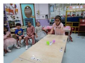
轆轆轆！滾蛋遊戲真有趣